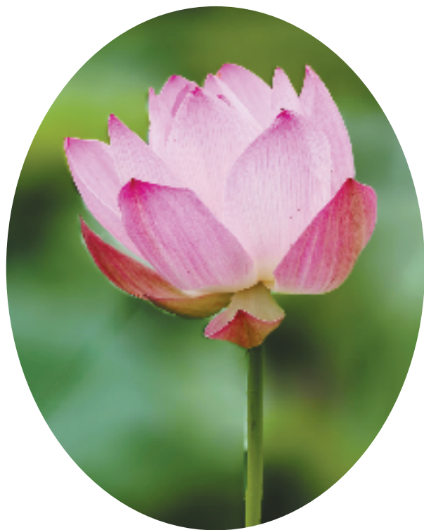
摄于台州黄岩永宁公园,特写镜头定格下一朵盛开的粉荷,背景被虚化的绿意晕染得温柔朦胧。用OPPO FindX9 Pro拍摄,光圈F1.4,快门1/200秒,感光度125,曝光补偿+0.5。 章祖跃