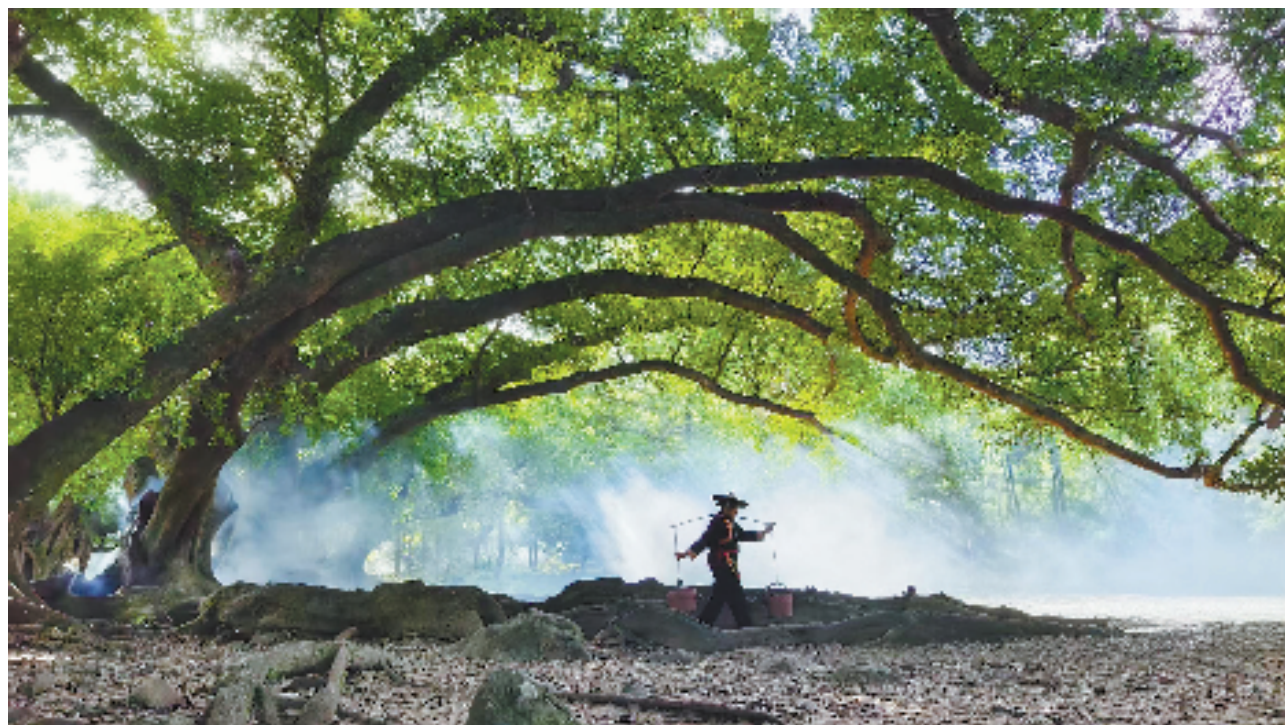
摄于福建霞浦杨家溪古榕群,以千年古榕为背景,将畲族挑担农妇与林间光影巧妙相融,动静相生。画面色彩以浓郁的绿为主调,农妇的深色衣装与红棕挑担让画面更具故事感。用VIVO X100 Pro相机拍摄,光圈F1.75,快门1/294秒,感光度50,曝光补偿0.60。 章建华

夏风穿林,染绿荷塘,更唤醒满林生机。这些镜头里,有晨雾古榕间的光影流动,有西湖荷叶上的露珠清圆,也有林间小鹿的悠然漫步。以层层绿意宣,以斑驳光影为笔,将夏日的森系温柔与鲜活定格。无论是荷塘的清新、林间的静谧,还是自然生灵的灵动,都在诉说着这个季节独有的诗意与治愈。