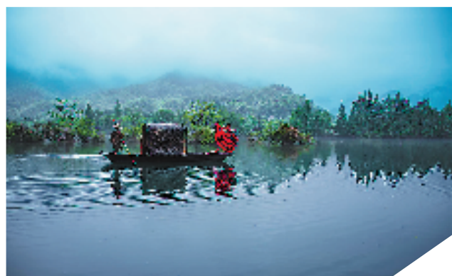
摄于钱塘江上游的重要支流乌溪江,以乌篷船为载体,红裙女子与背景的绿色山水巧妙相融,形成反差。尼康D850相机拍摄。拍摄参数为,光圈F8,快门1/125秒,感光度400,白平衡自动。 胡江丰