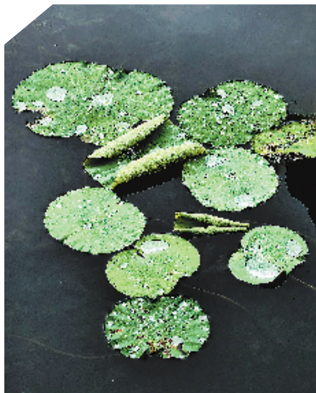
摄于杭州西湖断桥附近,俯拍视角下,西湖的荷叶如翠盘浮于水面,水珠晶莹剔透,自带夏日清透质感。用HUAWEI P60 Art拍摄,光圈F2.1,快门1/370秒,感光度50,曝光补偿-0.3。 李欣