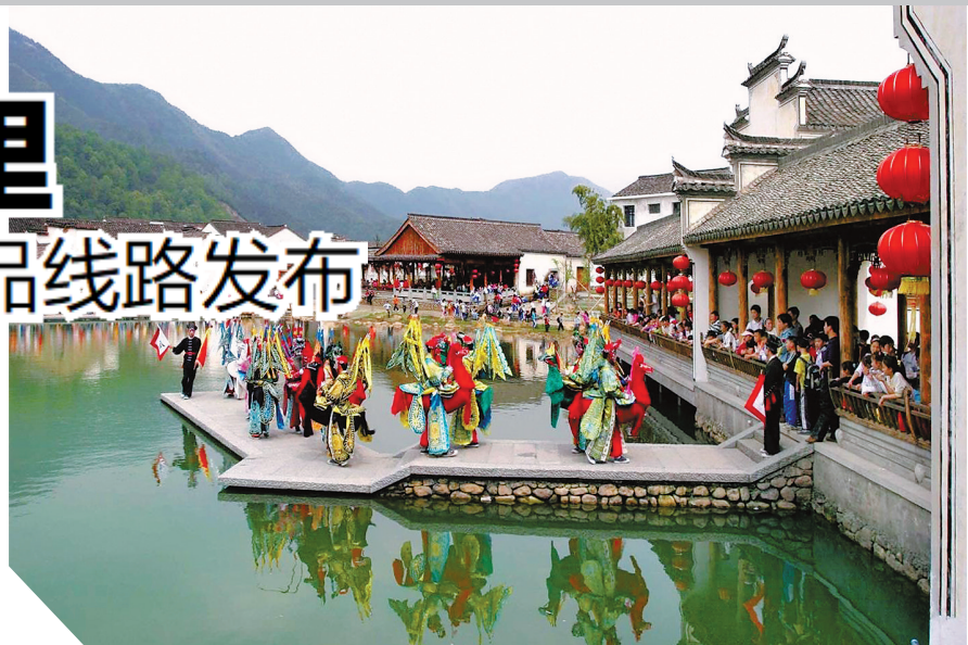
龙门古镇民俗竹马表演。