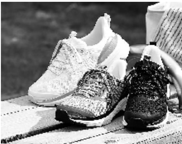
足部舒适护理鞋