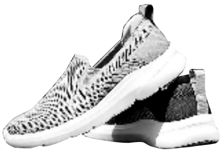
休闲防滑鞋