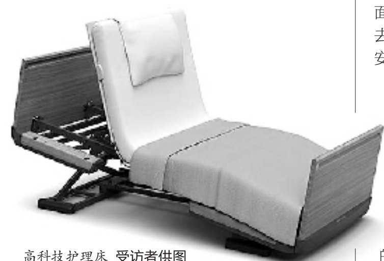
高科技护理床