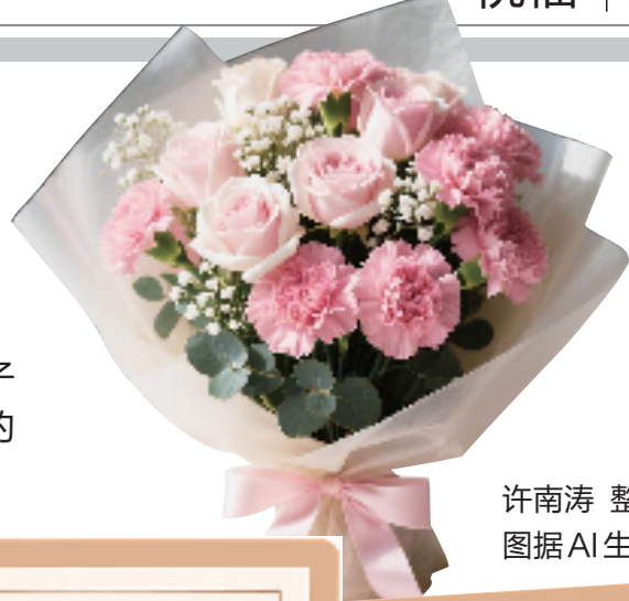
许南涛 整理

明天就是一年一度的教师节,在这个熟悉又充满感恩的日子里,参与2025年“传家宝 润家风”主题创作征集活动各个学校的同学们纷纷执笔,用最真挚的语言表达对老师的敬意与祝福。