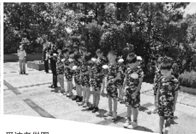
各地青少年参加“假日学校”活动。