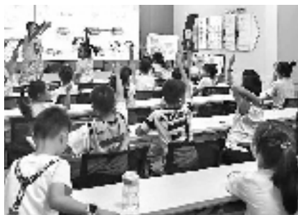
《良渚的陶器世界》上，孩子们积极互动。

“老师！我知道陶鼎是煮东西用的！”“这个陶碗上的花纹真特别！”……课堂上，同学们听得饶有兴致，并展开热烈交流，气氛活跃。大家表示，通过近距离观察实物、聆听历史故事和互动问答，不仅直观感受到了良渚陶器的魅力，更增进了对中华优秀传统文化的认知与兴趣。