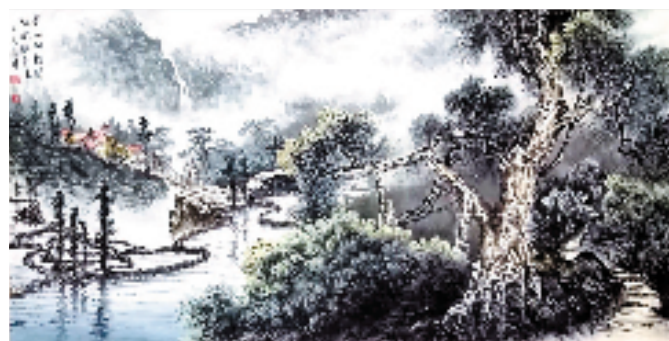
青山披锦绣 洪来祥