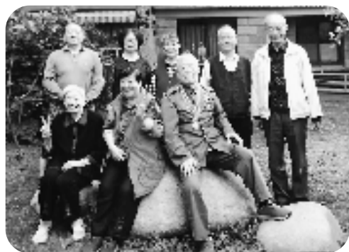
家庭成员合影。