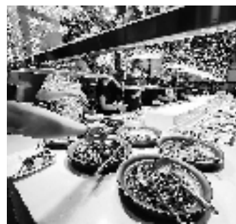
年轻人在老年食堂用餐。

“老”食堂,“新”变化。你会去老年食堂吃饭吗?现在的老年食堂怎么样?与过去相比有什么变化?我们向浙江的老年朋友开展网络问卷调查,共回收有效问卷192份。同时,在街头巷尾随机采访不同年龄段的路人,让我们一起看看他们眼中的老年食堂。