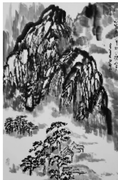
心宽志地窄,亭小得山多。张纯礼