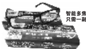
智能多焦 只需一副