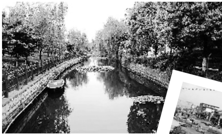
整治后的河水新貌

我的家乡在宁波镇海庄市万嘉桥。1970年初,我告别家乡应征入伍,随着光阴流逝,当年的情景和熟悉的面容渐渐淡去,唯有家乡的那条小河,深深印在我的脑海里,挥之不去。