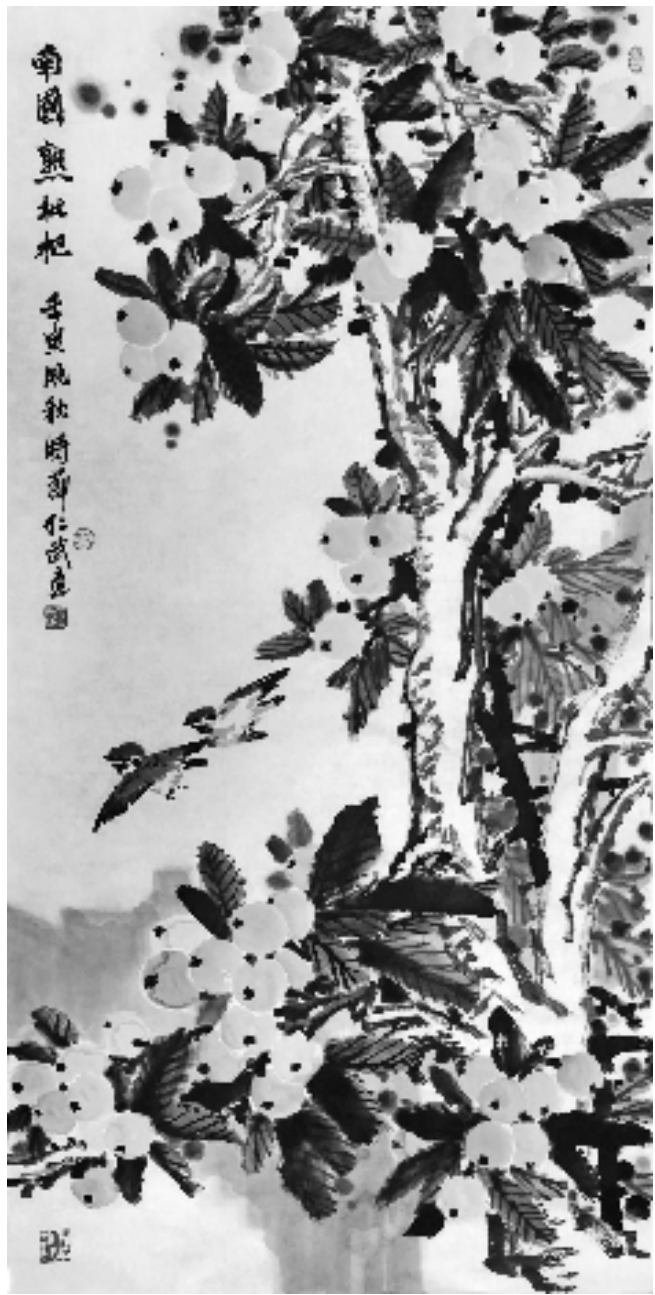
南国熟枇杷 手曳晚秋时 薛仁武画