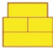
▲ 从侧面看时的样子