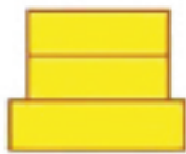
▲ 从前边看时的样子