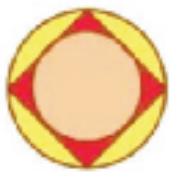
▲ 从上面看时的样子