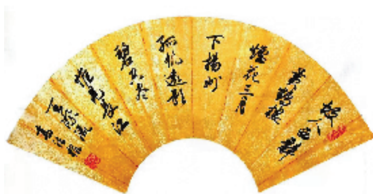
故人西辞黄鹤楼,烟花三月下扬州。 孤帆远影碧空尽,唯见长江天际流。高法根